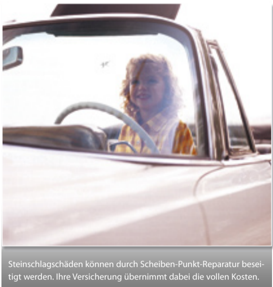
Steinschlagschäden können durch Scheiben-Punkt-Reparatur beseitigt werden. Ihre Versicherung übernimmt dabei die vollen Kosten.