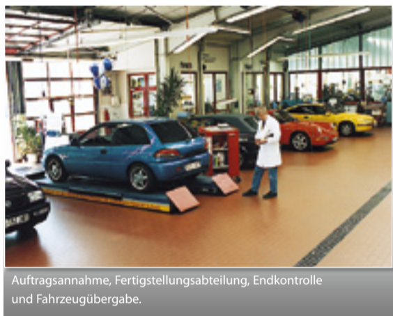
Auftragsannahme, Fertigstellungsabteilung, Endkontrolle und Fahrzeugübergabe.