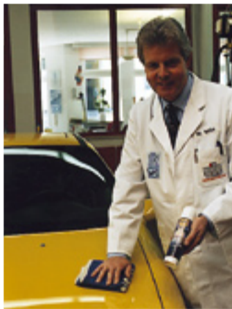
Laser Wash von PRO TECH LINE – das „Zaubermittel“ zum Polieren im Handumdrehen. Ideal für die Anwendung daheim. Wie alle erprobten Pflegeprodukte von Wille.

Innovationsbereitschaft setzt Aufgeschlossenheit und das sichere Gespür für höchste Ansprüche der Kunden voraus. Auf der Suche nach sinnvollen, zusätzlichen Leistungen ist Wille deshalb schon immer Wegbereiter gewesen. Die Pflegeprodukte der PRO TECH LINE sind dafür ein gutes Beispiel. Alle PRO TECH Produkte gibt es bei Wille exklusiv mit Vorführung .