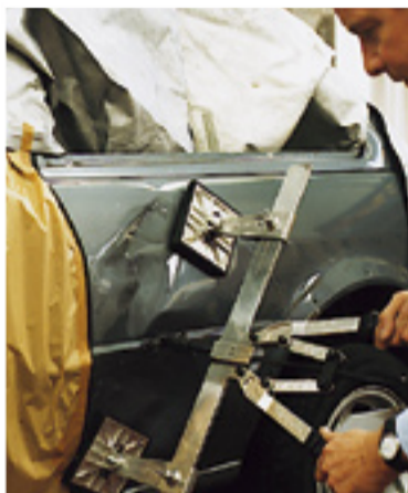
Erstmals in Deutschland bei Wille eingesetzt: das Miracle-Ausbeulsystem für großflächige Beulen mit erheblicher Zeit- und Kostensparnis für Autobesitzer und Versicherungen.