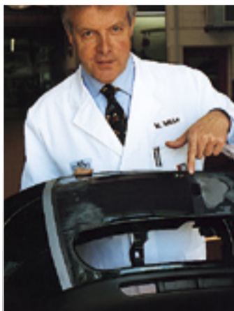
Teure Kunststoff-Stoßfänger lassen sich preiswert und umweltgerecht instandsetzen.

Ausbeulen ohne Lackbeschädigung mit einem patentierten Verfahren aus den USA, sehr kostengünstige Karosserie-Reparatur mit einer ganz neuen Methode (Miracle), preiswerte Kunststoffreparaturen mit Garantie statt teurer Austauschteile, Scheibenreparatur statt kostenintensivem Auswechselln – das hat nicht jeder, das kann nicht jeder. Das nennt man „sanfte Instandsetzung“ – ökologische Reparaturen zum Erhalt unserer Ressourcen.