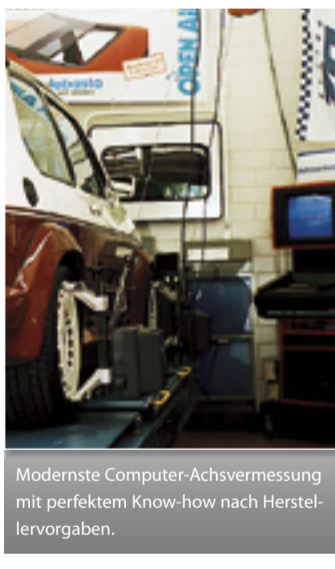
Modernste Computer-Achsvermessung mit perfektem Know-how nach Herstellervorgaben.

Großer Schaden, kleiner Aufwand – Die „sanfte“ Reparatur-Methode für ärgerliche Beschädigungen von Kratzern (1), Interieurs (2) und Polstern oder Leder (3).