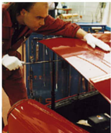
Ausbeulen ohne Lackbeschädigung – die preiswerte Hilfe bei kleinen Park- oder Hagelschäden. Keine Wertminderung!