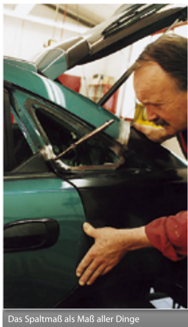
Das Spaltmaß als Maß aller Dinge