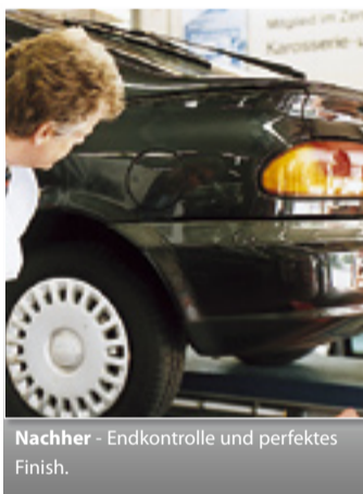
Nachher - Endkontrolle und perfektes Finish.

Auch den ganzen „Kleinkram“ mit der Versicherung und die technische Abwicklung übernehmen wir gerne für Sie.